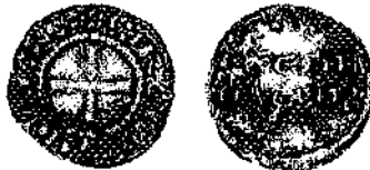
afb. 1 : penning van Karel de Eenvoudige (912-923) geslagen in het bisdom Straatsburg.

Als typische landen met een sterk gefeodaliseerde munt springen Duitsland en Frankrijk in het oog. Noch het capitularium van Thionville (805) dat de centralisering van de munt beoogde (3), noch het Edict van Pitres (864) dat het aantal ateliers beperkte (4), konden orde op zaken stellen in het Karolingische muntwezen. De 10de eeuw geldt als een mijlpaal in de evolutie. De bisschop van Konstanz (+ 919) had de primeur, als kanselier van koning Konrad, om zijn eigen naam op munten aan te brengen lang vóór zijn opvolgers tot de muntslag overgingen (5). Zijn tijdgenoot Odbert, bisschop van Straatsburg (+ 913), durfde amper zijn initialen toevoegen aan munten van Lodewijk het Kind en Karel de Eenvoudige (6).